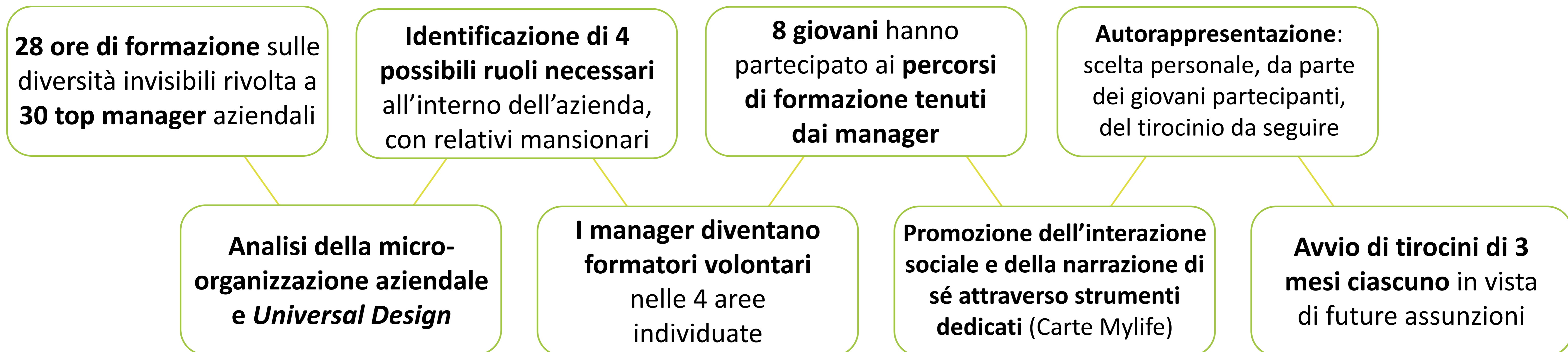
Fig. 2 – Diagramma di flusso riassuntivo dei diversi step del progetto FormidAbilmente ATStaff.